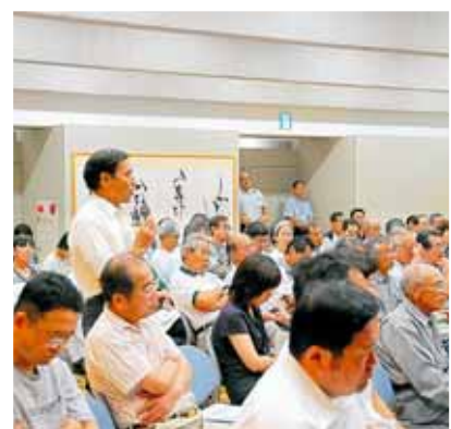
熱心に耳を傾ける参加者

「わがまちげんき発掘・創造・発展事業」により、「北谷の鯖の熟れ鮎」をはじめとする、様々な地域特産品が生まれ、また、「越前禅定道修験者マラン」などの地域特性に根差したまちづくり事業が展開されています。 さらに、まちづくりだけではなく、行財政改革によって健全財政に努め、勝山市に自信と誇りを持てるよう、様々な事業を展開してきました。