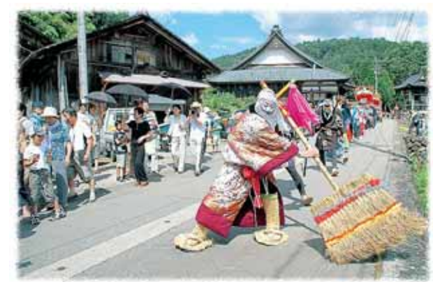
谷はやし込み行列