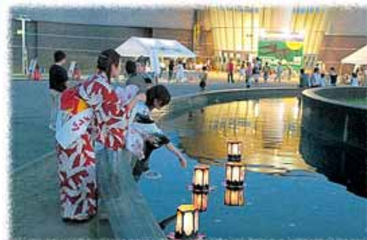
恐竜博物館ナイトミュージアム