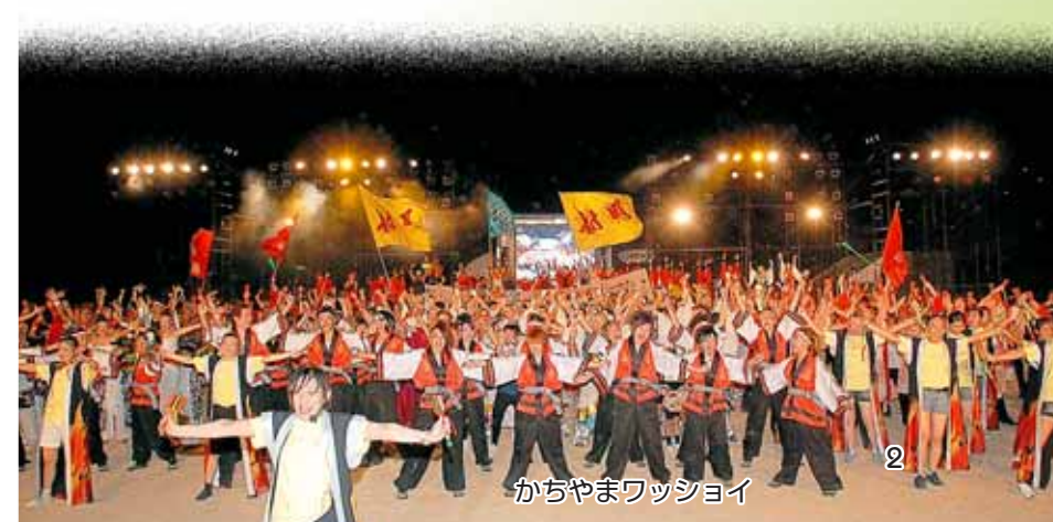
かちやまワッショイ