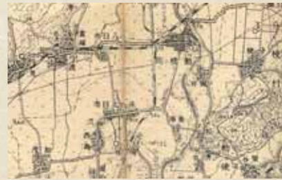
額田荘と伝える加賀市の動橋付近 (右書き)

は、見出しは「きみな(公名・君名・卿名)」で、その意味は「比叡山などで、父親の官名をとった幼童の呼び名。貴族の子弟を弟子とするとき