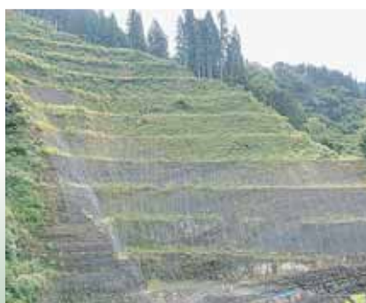
日本の恐竜化石の約8割を産出する恐竜化石発掘地（北谷町杉山）

る、学術・文化的に貴重な地質遺産（地層、岩石、断層、火山等）に親しみ、学び、楽しめる場所を複数含む自然公園を意味しています。 今後、勝山市としてはジオパーク認定を弾みに、市内にジオパーク推進室（仮称）を設置し、県立恐竜博物館など関係機関との連携を図りながら、市内の貴重な地質遺産（ジオサイト）の保全、保護ならびに活用を推進していくとともに、地質遺産を通じたジオツーリズムなどを推進し、地域活性化・地域経済の発展を図ってまいります。