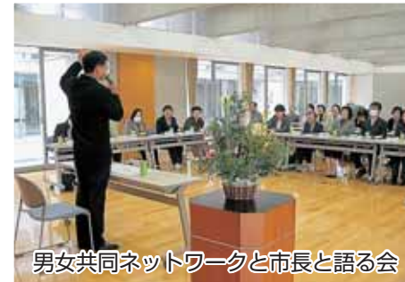
男女共同ネットワークと市長と語る会

その一環として、市内にある各種団体などと市長と語る会を随時開催しています。これまで、各界各層の皆様とこれからのまちづくりについて意見交換を行いました。今後も、さまざまな視点からのご意見、ご提案をいただき、計画づくりに反映してまいります。