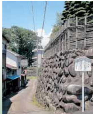
河岸段丘によって形成された七里壁