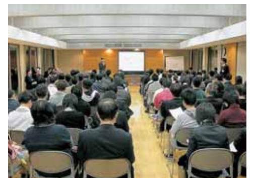
夢のあるまちづくりについて、市長と意見交換