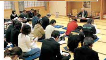
野向小学校区での小中学校の望ましいあり方座談会（11月5日開催）