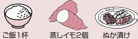
ご飯1杯 蒸しイモ2個 めか漬け