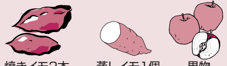
焼きイモ2本 蒸しイモ1個 果物