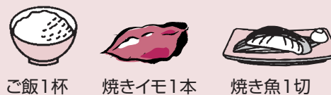
ご飯1杯 焼きイモ1本 焼き魚1切

生産しやすいイモ類を作るなど、最低限必要な食料は確保できるけど、食事の内容はすいぶん変わってしまうのよ。