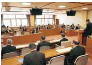
窓を開け、間隔を空けるなど議場で感染症防止策を実施