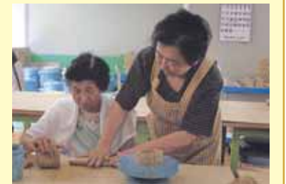
初めての陶芸体験! できあがり楽しみ・9月