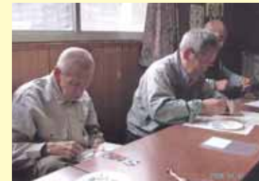
文化祭に向け男性も 押し花手芸に挑戦・10月