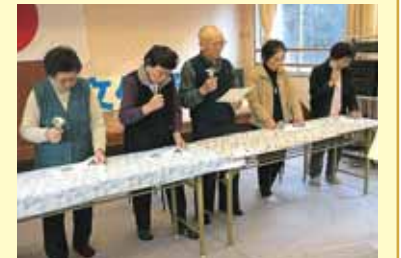
ハンドベルの音色で クリスマス会・12月