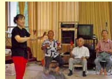
楽器を使って にこにこリハビリ体操・8月