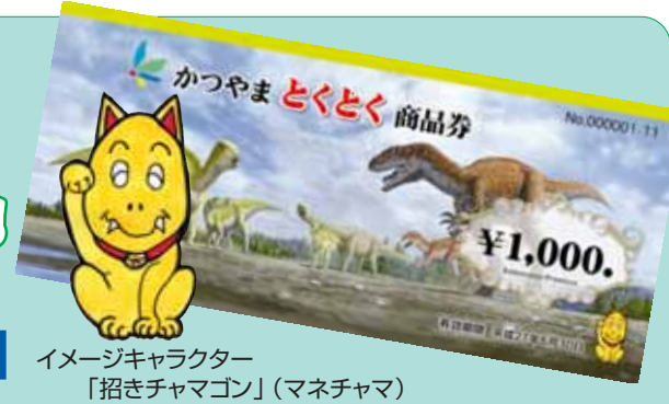
イメージキャラクター 「招きチャマゴン」(マネチャマ)