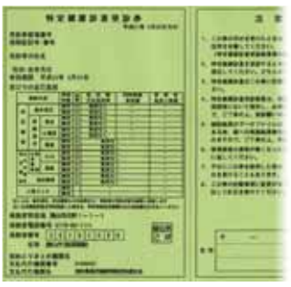
後期高齢者健診受診券（見本）

■75歳以上のかた（後期高齢者健診） 長寿医療（後期高齢者医療）制度加入の皆様には、「後期高齢者健診のご案内」を5月下旬までに送付します。