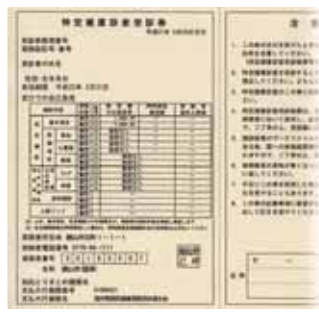
特定健診受診券（見本）

■40歳～74歳のかた（特定健診） 国民健康保険加入の皆様には、がん検診とあわせて「特定健康診査受診券」を5月下旬までに送付します。