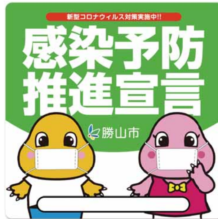
勝山市の宣言ステッカー

対象となる事業例▶ • レジやカウンターなどへのパーティション、ビニールシートの設置 • 座席の間隔を確保するための改修 など 補助対象期間▶5月18日～12月28日 補助金額▶補助対象経費の80%(上限12万円) 課(市役所2階) ☎88-8105