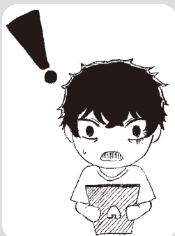
イラスト/勝山高校芸術部

Q1 インスタグラムのインフルエンサーが紹介していたイヤフォンをインターネットで申し込んだが、サイトに書いてある電話番号にかけてみたら、別の会社につながった。細かい説明もすべて英語で書いてあった。もしかしてだまされたのでしょうか？ (男性、10代)