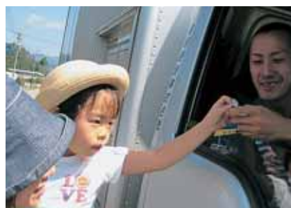
交通安全マスコット渡し