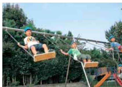
こんなに高く乗れるんだ!