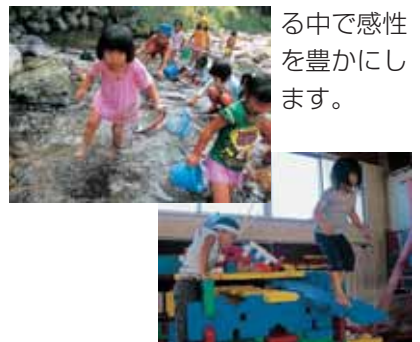
川遊びとごっこ遊び

ごっこ遊びなどを通して感じたことを自由に表現したり、自然に触れる中で感性を豊かにします。