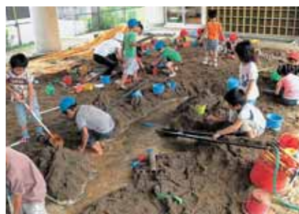
南幼稚園での泥んこ遊び