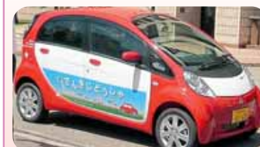
福井県が導入した電気自動車