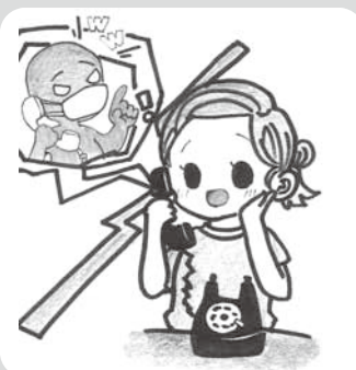
イラスト/勝山高校芸術部

このような「定期購入」のトラブルが後を絶ちません。インターネットでの契約も多くみられます。「お試し価格〇〇円！」などの甘い言葉にだまされないようにしましょう。