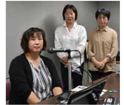
朗読ボランティア「ゆーあい」の皆さん

朗読ボランティア「ゆーあい」は、「広報かつやま」を朗読・収録し、希望する方に届ける活動に取り組んでいます。 声の高さやしゃべる速さを調整したり、季節感を混ぜたりすることで、より聞きやすい、親しみやすい朗読を行っています。 時には、相手から改善の提案をもらったり、読み上げを通じた相手とのコミュニケーションも図っています。