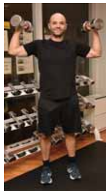
スポーツも好きで筋トレも実施中 (ジオアリーナ)

【英会話教室】 11月15日(月)・22日(月)・29日(月)午後7時～9時 勝山教育会館 第4研修室