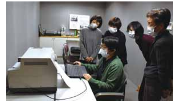
点訳サークル「ふきのとう」の皆さん

点訳サークル「ふきのとう」は、「広報かつやま」などの印刷物や書物を点訳（*）したり、定期的な勉強会を開催し、点訳技術の維持向上を図っています。 これまで、市内飲食店15店舗のランチメニューの点訳にも取り組まれました。 また、小学校の授業やクラブ活動で行われた点字教室の講師を務めるなど、福祉教育の推進にも積極的に取り組んでいます。 * 普通の文字を点字に翻訳すること