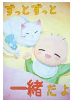
青少年健全育成啓発用 関画・ポスターコンクール 横山結香(勝山南部3)