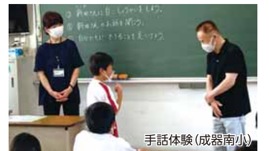
手話体験(成器南小)

各小学校では、車椅子体験や手話体験など障がいを身近に感じる体験学習のほか、車椅子アスリートの話や赤ちゃんのお世話体験、高齢者の認知症についての学習など多様なテーマで福祉教育が行われています。そこでは、様々な人が暮らす地域で「一緒に生きていくことの大切さ」や「命の大切さ」が伝えられています。 体験だけで終わらせない 年間を通じた福祉教育 「子どもたちには「障がいがある」と大変だ。年を取ることは嫌なことだ」といった自分本意な感想で終わってほしくない」と話す社会福祉