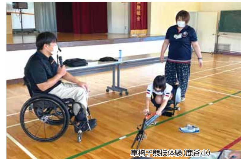
車椅子競技体験(鹿谷小)

勝山市社会福祉協議会と各地区社会福祉協議会が協力して取り組む「福祉教育」をご紹介します。