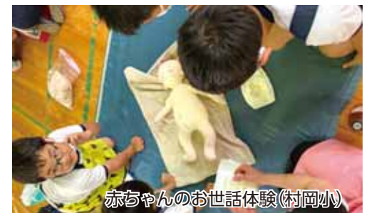
赤ちゃんのお世話体験(村岡小)