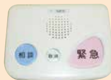
緊急通報システム(シルバーコール)