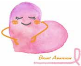
ブレスト・アウェアネス イメージキャラクター (日本乳がん検診学会)

日頃から自分の乳房を意識し、普段の状態を知っておくことで、異常の出現に気づくことができま。特に閉経前の女性は、月経周期に伴う変化を知ることが大切です。まず、自分の乳房の状態を知ることが、ブレスト・アウェアネスの第一歩です。