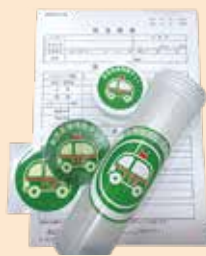
救急医療情報キット