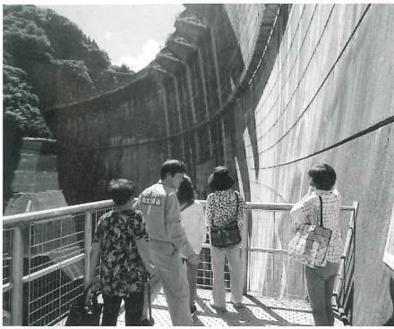
真名川ダムにおいて

昼食は「のむき風の郷」で購入したお弁当を車中に積み、「旧木下家住宅」まで移動しました。「のむき風の郷」では地元で収穫された野菜等が販売されており、食材が豊富。その食材でのお弁当とあって、とてもおいしくいただきました。地産地消、安心安全のお弁当でした。