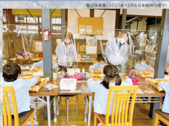
鹿谷保育園(2021年12月6日来館時の様子)