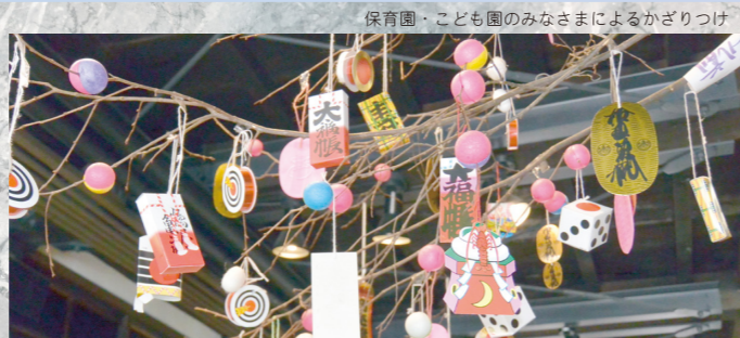
保育園・子ども園のみなさまによるかざりつけ