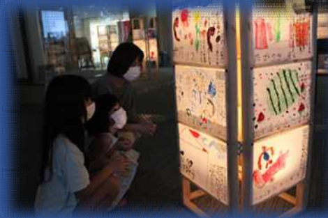
昨年の展示の様子