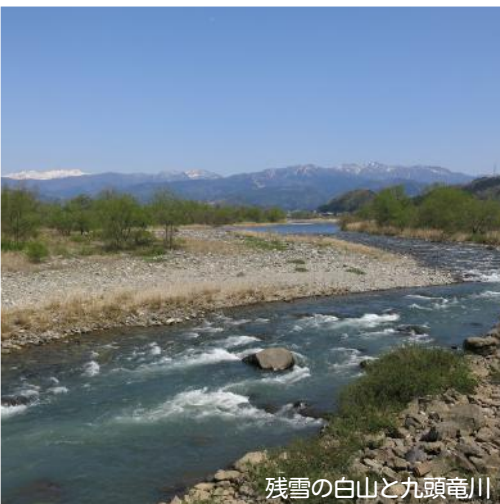
残雪の白山と九頭竜川

悠久の地球を体感できるジオパーク。生物と文化の多様性を育む大地を、持続可能性を支える自然の基（もと）として捉え、ESD教材としての活用を考えるダイアログを開催します。 様々なESD学習活動に携わる皆様はもちろん、自然やSDGsにご興味のある方、参加をお待ちしています。