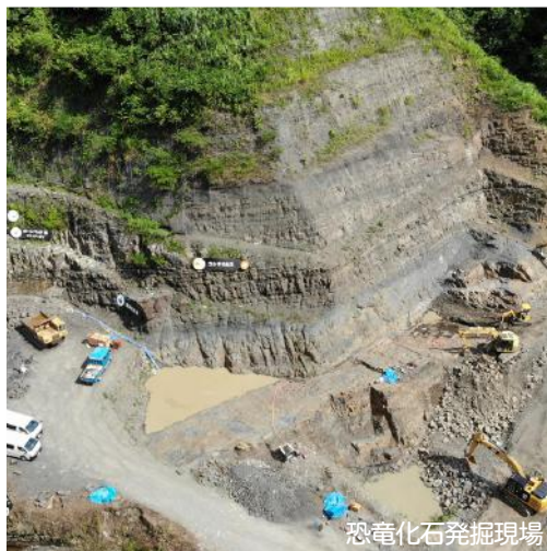
恐竜化石発掘現場