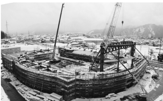
新体育館建設状況（平成27年3月13日）