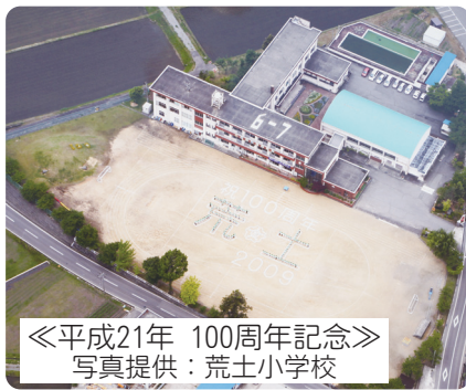
◀平成21年 100周年記念▶