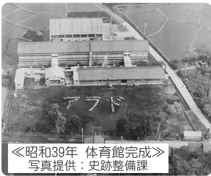
◀昭和39年 体育館完成▶