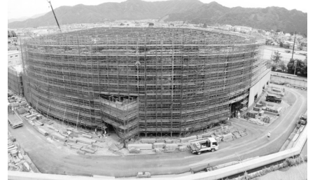
新体育館建設状況 (平成27年6月5日)