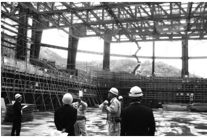
新体育館建設状況視察 (平成27年5月13日)