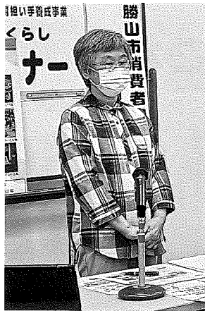
くらしの研究所での ゲストスピーチ