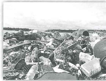
2023年1月の越前海岸 プラスチックゴミ漂着