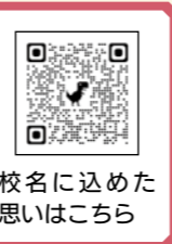
校名に込めた 思いはこちら