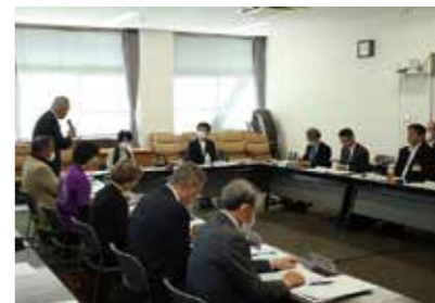
調査員にあいさつする水上市長

現地調査では、令和元年10月から4年間の活動実績の報告のほか、関係団体の活動紹介やゆめおれ勝山など関連施設の視察、勝山市ジオ