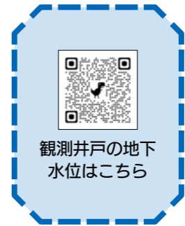
観測井戸の地下水位はこちら

観測井戸(立川水源地敷地内)の地下水位が一定の基準水位を下回った場合、市民の皆さまや事業所さまに節水の協力を要請します。ご協力をお願いします。