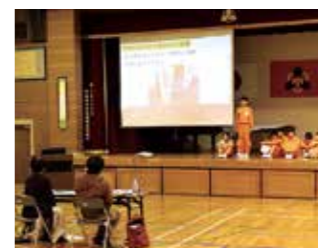
調査員に活動内容を発表する平泉寺小学校の皆さん