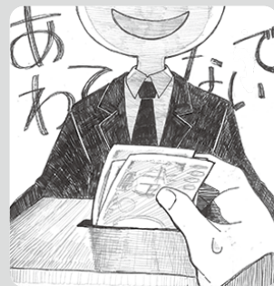
イラスト/勝山高校芸術部

Q1 被災地へお金を寄附したいが、問題があ るところはないか。 (女性、70代)