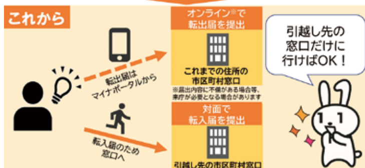
出典) デジタル庁：引越し手続きオンラインサービスリーフレット

マイナポータルからオンラインで転出届を提出すると、これまでの住所の市役所への来庁が原則不要になるよ！ 転出する方単身での引越しのほか、ご自身と同一世帯員、ご自身以外の世帯員の方の引越しでも利用できるよ。