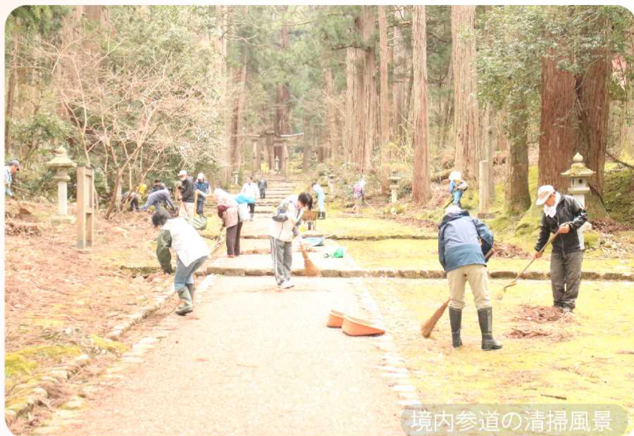
境内参道の清掃風景