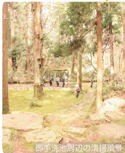
御手洗池周辺の清掃風景

4月13日の早朝、恒例の平泉寺春の一斉清掃が行われました。区民約120名と約80名のボランティアの方が冬の間降り積もった杉葉を取り除きました。掃き清められた境内には、鮮やかな苔の緑がよみがえっています。