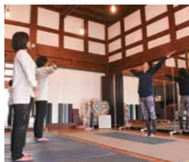
解放感あふれるスペースでのヨガ教室