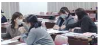
担任同士の情報交換の様子