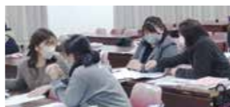
担任同士の情報交換の様子