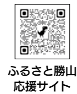
ふるさと勝山 応援サイト