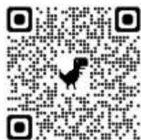
白山平泉寺歴史探遊館まほろば