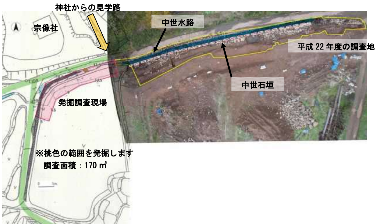
発掘調査現場 位置図