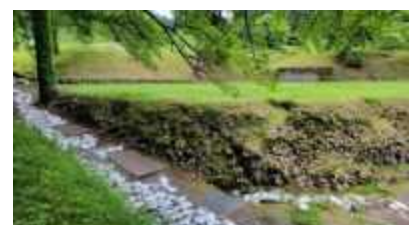
発掘調査現場の遠景（西から）