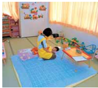
静かな環境で安心です

ひかり病児保育園 (クリニカ・デ・ふかや内) ☎88-02008 【開園時間】 午前8時30分 午後5時30分 【休園日】 土、日、祝日 【利用料金】 1日2000円 (おやつ・昼食込み) ※診察料は別途かかります ※定員を超えている場合は、ご利用になれません。