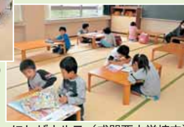
にしザウルス(成器西小学校内)

勝山市内には、児童センターが10ヶ所あります。 児童センターは、 ① 放課後などの遊び場 ② 留守家庭の児童の生活の場 ③ 子どもの体験・交流・学習の場として、すべての小学生に無料で開放しています。 昨年、成器西小学校区と村岡小学校区の児童センターについて、機能を学校の中へ移転しました。 機能的な学校の中へ移転しました。利便性が高まり、利用者も増えていきます。ぜひご利用ください。