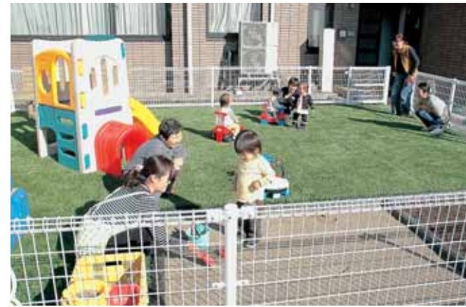
園庭が完成しました

■ 広がってきれいになりました カンガルーのお部屋(勝山市地域子育て支援センター)は、利用者増加による駐車場不足や、親子のふれあいスペースが手狭になったことから、今年の8月に奥越地域地場産業振興センターの2階和室に移転しました。 親子ふれあいスペースは、従来より約3倍の広さを確保。駐車場も広くなり、新しい遊具も増えました。 子育ての悩み相談にも応じます。ぜひお気軽に遊びにきてください。 問 地域子育て支援センター (奥越地域地場産業振興センター内) ☎87-3830