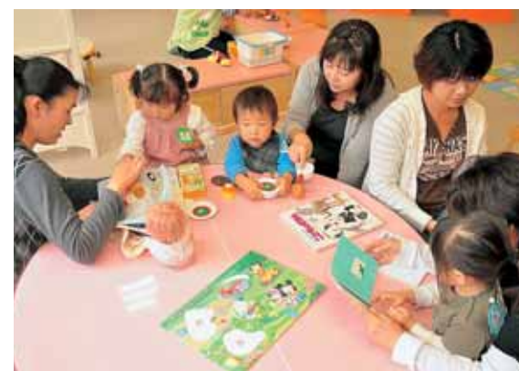
親子のふれあいや、お母さんの情報交換の場です