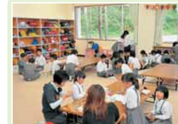
むろこザウルス(村岡小学校内)