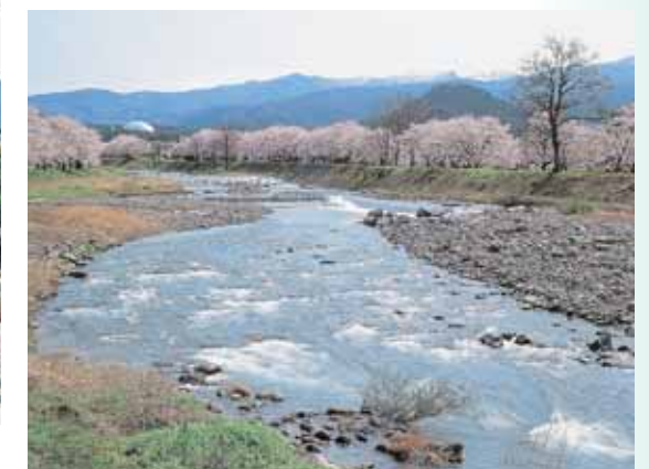
福井県立恐竜博物館が見える風景（滝波川）