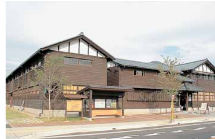
はたや記念館 ゆめおーれ勝山

景観重要建造物および景観重要樹木の指定の方針 地域のシンボルとなるような景観上の特徴を有する建造物（建築物・工作物）・樹木などの景観資源は、エコミュージアムによるまちづくりを推進していくための大切な展示物です。このため、景観計画では、良好な景観形成に重要な役割を果たす建造物および樹木を、景観重要建造物および景観重要樹木に指定するための方針を記述します。