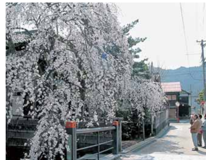
花月楼のしだれ桜

景観重要建造物および景観重要樹木の指定の方針 地域のシンボルとなるような景観上の特徴を有する建造物（建築物・工作物）・樹木などの景観資源は、エコミュージアムによるまちづくりを推進していくための大切な展示物です。このため、景観計画では、良好な景観形成に重要な役割を果たす建造物および樹木を、景観重要建造物および景観重要樹木に指定するための方針を記述します。