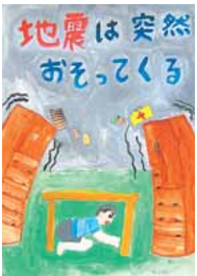
稲木奎牙さんの作品