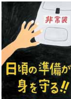
松村伊悟さんの作品