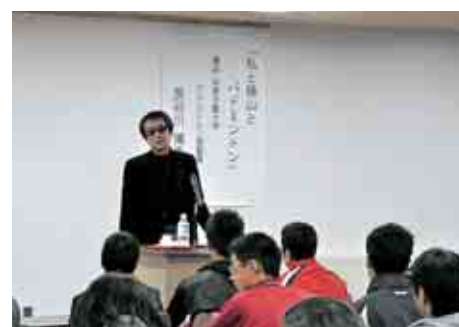
小中学生の選手対象に講演会も行いました