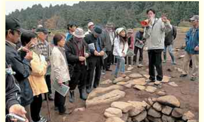
平泉寺発掘現場での説明会