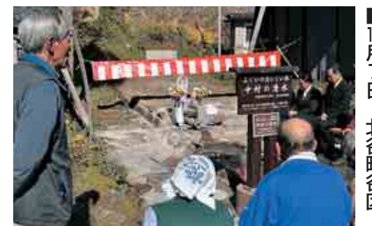
「ふくいのおいしい水」に指定されている「中村の清水」が県補助金を受けて改修され、その完成祭が行われました。

平成13年から毎年開催している白山文化フォーラムが開催され、市内外から多くのかたが参加しました。午前中は平泉寺の発掘現場での史跡見学会があり、今年度の発掘成果の説明がされました。午後は市民フォーラムの中で、講演会とパネルディスカッションが行われ、白山信仰の歴史背景などについて興味深いお話が聞けました。