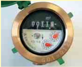
メーターのチェックを!

冬期間の水道管の凍結 毎年、水道管が凍結して破損し、漏水する事故が多発しています。メーターの値を確認することで、漏水を早期に発見できます。 ◆冬期間であっても水道メーターを検針できる状態にしておきましょう ◆屋外の水道管や蛇口は防寒しましょう ◆長期不在にされる場合は、給水中止の手続きをとるか、水道メーター横にある止水栓を閉めてください ◆漏水した場合は、早急に指定給水工事業者に修繕を依頼してください