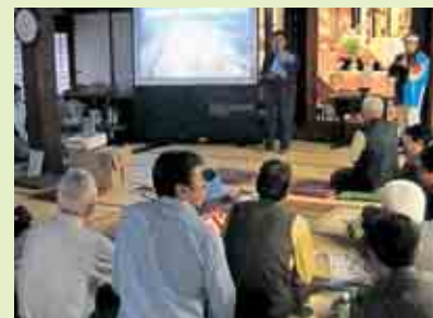
上丹生との交流会の様子