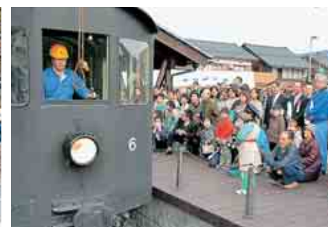
専用線路を走る「テキ6」