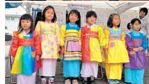
写真上：展示の様子 写真下：優秀作品6点が実際の衣装に！

勝山の繊維産業を紹介する繊維展が開催されました。幼稚園児の描いた織子さんのぬり絵の優秀作品を、実際に衣装にした発表会も行われました。