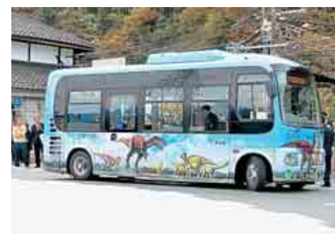
ロータリーからの初出発