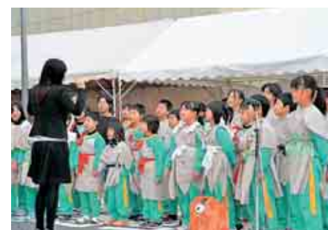
三室小学校児童による合唱