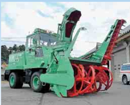
新しいロータリー除雪車