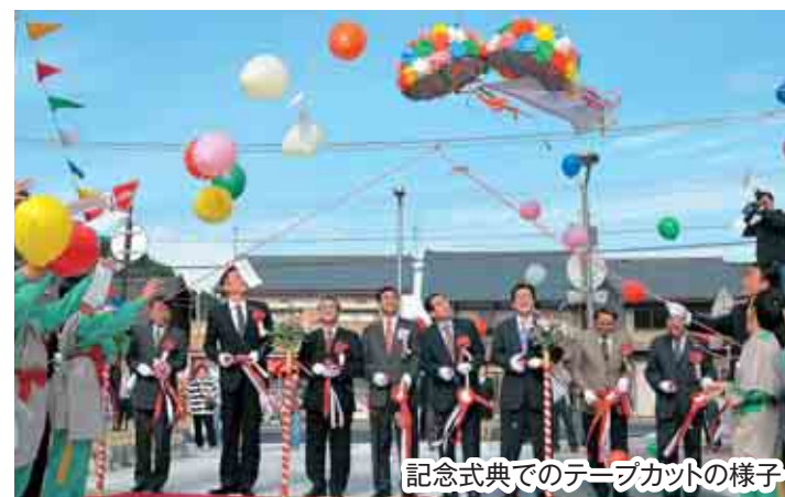
記念式典でのテーブルカットの様子