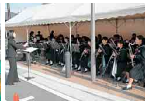
勝山南部中学校吹奏楽部による演奏