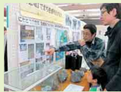
恐竜部会のブース

まず、エコ協の成り立ちや現在の活動を発表し、「谷のはやし込み」も披露しました。昼食は、なめこ汁「縄文の里料理研究会」が作った郷土料理のお弁当をいただきました。