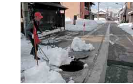
投雪口には赤旗の掲示を!