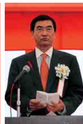
祝辞を述べる山岸市長