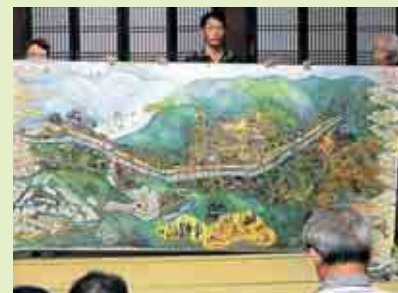
心象風景の屏風(レプリカ)