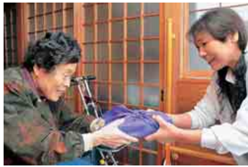
月2回、民生委員が自宅にお届けします

対象▼65歳以上の高齢者世帯で、要介護者として市の名簿（福祉票）に記載されている方 費用▼1食210円