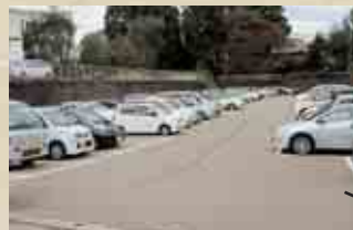
教育会館裏の駐車場