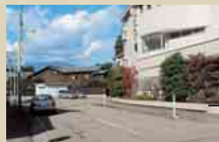
石叡歯科医院横の市道