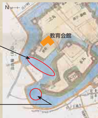
勝山城郭復元図(部分)

リートの擁壁が設けられている。また、石叡歯科医院が建つ場所は、本丸西堀の真つ只中であった。西側に道路が半円形に設けられているが、本丸西堀をめぐる道(拡幅されている)であった。左の写真に見られる市道も「堀端」と呼ばれる狭い道であった。