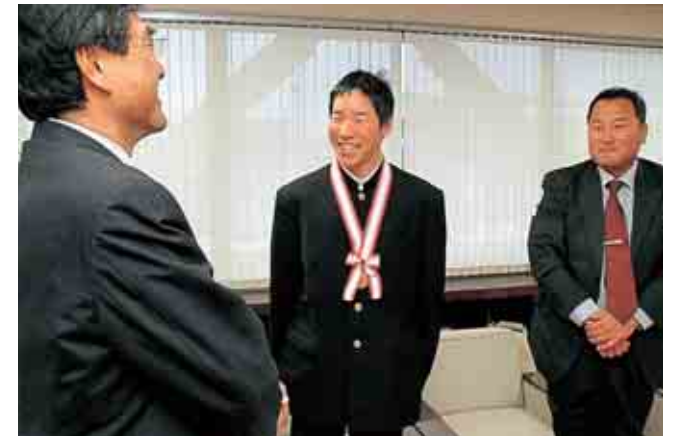
市長に優勝報告する宇田選手