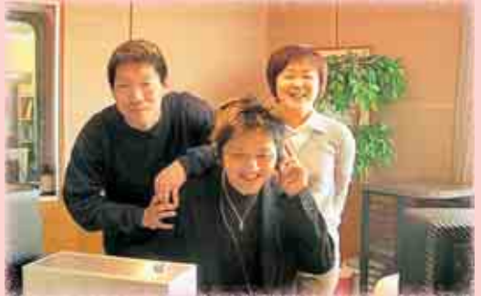
FM福井の番組作成スタッフ

番組名 「キラリかっちゃん☆ほやほやラジオ」 放送日時 毎週水曜日 午後1時～1時55分 放送局 FM福井(大野・勝山 84.7MHz)