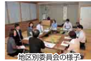
地区別委員会の様子

5月20日（金）に次世代育成委員会全体会が開催され、各地区において現在・これからの子どもたちにより必要なもの、改善・強化するための具体的な取り組み内容が話し合われました。