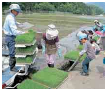
田植え見学の様子