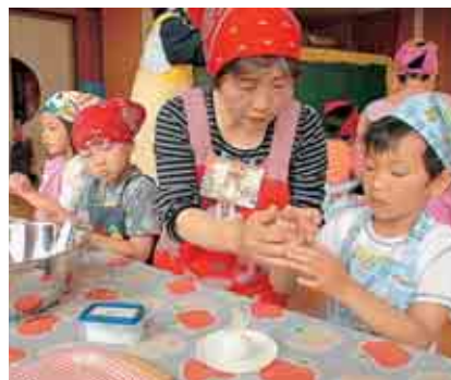
おにぎり作りの様子