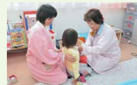
園内の様子 (写真は看護師が回診しているところです)