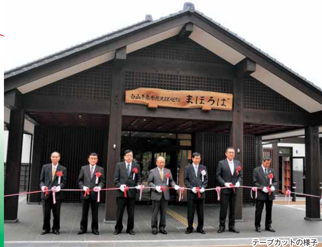
テープカットの様子

「自然の中を走るこの大会は、他の大会より好きです。今年は、娘夫婦や孫と一緒に参加できました。ゴール後の爽快感を、家族や仲間と分かち合うことができ嬉しかったです。」