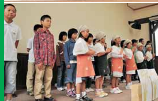
平泉寺小学校児童による寸劇と歌