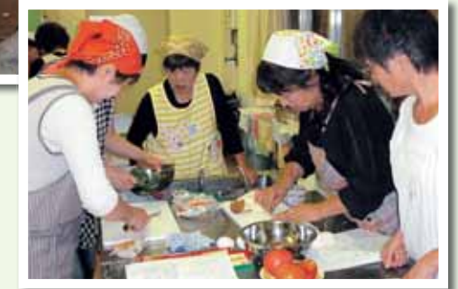
写真上：手芸クラブの皆さん 写真下：料理クラブの様子 この他に体操、音楽、小旅行を企画するぶち旅行のクラブがあります。