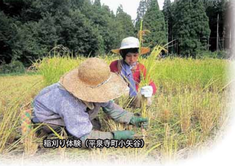
稲刈り体験 (平泉寺町小矢谷)