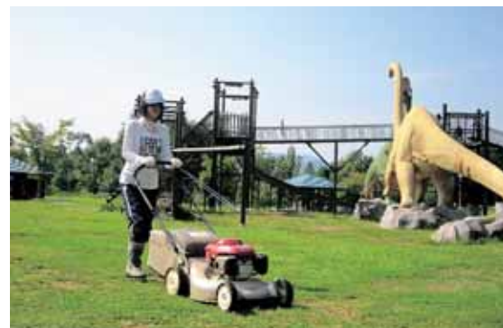
芝刈り (かつやま恐竜の森)

■住み込みでお手伝い 勝山市では、平成20年度から田舎暮らし体験交流事業を実施しています。この事業は、都会から参加者を募り、市内の農家で農業などを手伝う代わりに、食事と宿泊先を提供するものです。県と連携して、都市圏のほかにも各NPO団体や大学などへ情報発信し、現在では、NICE (日本国際ワークキャンプセンター) や大阪府立大学などと友好を深め、毎年多くの参加者が勝山市を訪れています。