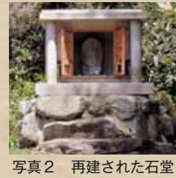
写真2 再建された石堂

現在の野向町域に「合月村」があった。この村があった場所は、薬師神谷の小字「堂の前」「袖合月」の辺りから滝波川北岸にかけて東に細長く広がっている地域であると言われ、「柳平」「上赤谷」までのほぼ三〇の小字が含まれる。 ここは、古来より開拓された七町歩(七ヘクタール)の農地と付近に山林を控えた台地があったと言われている。ここには先述の「堂の前」に石観音堂があり、「間数少之石堂、合月新田之内二御座候」と記される(宝暦九年(一七五九)村明細帳)薬師神谷高田政右衛門文書)。近年、石堂が破損したため、新しい石堂(写真2参照)に安置している。御神体は、身の丈四〇センチメートルの観音像で、蓮台の上に座している。薬師神谷区の伝承では、この石観音は当初一寸八分の黄金の観音像であったと言われている。 この合月村は、「正保郷帳(一六四