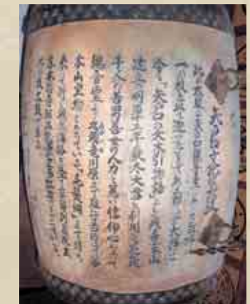
浄信寺の太鼓の胴に書かれた銘文

京都東本願寺の阿弥陀堂の正面に建っている二つの柱の間の虹梁は、鹿谷町矢戸口から運ばれたものである。矢戸口の湯屋谷には、観音堂(白山神社、大堂さんともいう)が明治末年まであった。明治十三年(一八八〇)の冬、この境内にあった大櫓が伐採され、雪の上を九頭竜川(赤岩付近)まで人力で引いて運ばれた。この大櫓の大きさは、回り二丈七尺(約八・一メートル)、長さ八間半(約十五・三メートル)余りで、大人四人がかりで抱えることができる巨樹であった。(浄信寺山門の「巨樹之枝太鼓の由来」による)