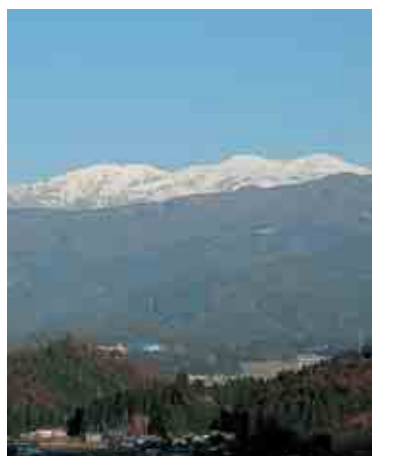
中部縦貫自動車道から白山を望む

まちをまるごと博物館 具体的には、現在の勝山市を形づくってきた歴史や伝統・文化、昔から守られてきた自然景観・環境、さらには平泉寺や恐竜化石など古いものが眠っている。そういった古いものの良いところを掘り起こし、自分たちの活動の中に取り入れていくことです。 古いものには有形・無形があつて、有形のものは歴史的発掘などで出てきますが、無形のもの、住んでいる人たちが先祖のことを思い返しながらか、復活させなくてはいけない。これには大変な努力が必要なわけ