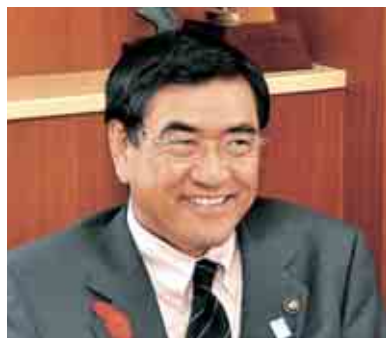
勝山市長 山岸正裕

市長 コミュニティというか、 近所のお付き合いの範囲が どんどん広がって、勝山全