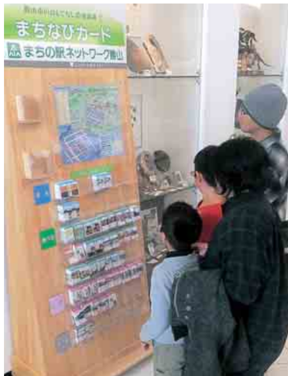
恐竜博物館の来館者の目に留まっています

市内には『まちなびカード』が36駅あり、店舗内に観光パンフレットを設置したり、トイレ・くつろぎスペースを提供した