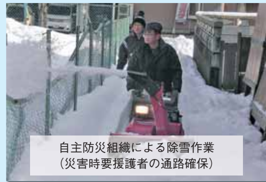
自主防災組織による除雪作業 (災害時要援護者の通路確保)

自治会などを単位とし、様々な地域活動を基盤として、地域の安心・安全な生活を確保するための防災活動などを行う組織。