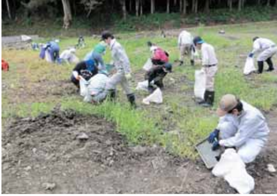
陸前高田市でのがれきの撤去作業

引き続き寄附金を募集します！ 今年度も被災地の復興活動や被災地の子どもたちとの交流活動を行いますので、引き続き皆さまからの寄附をお願いします。