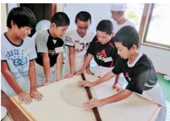
陸前高田市の児童を招待（そば打ち体験）