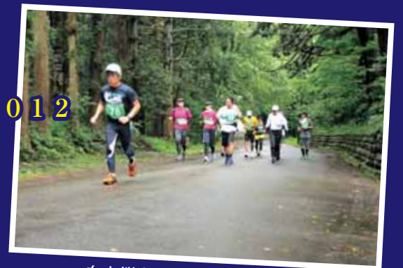
白山禅定道トレイルマラソン