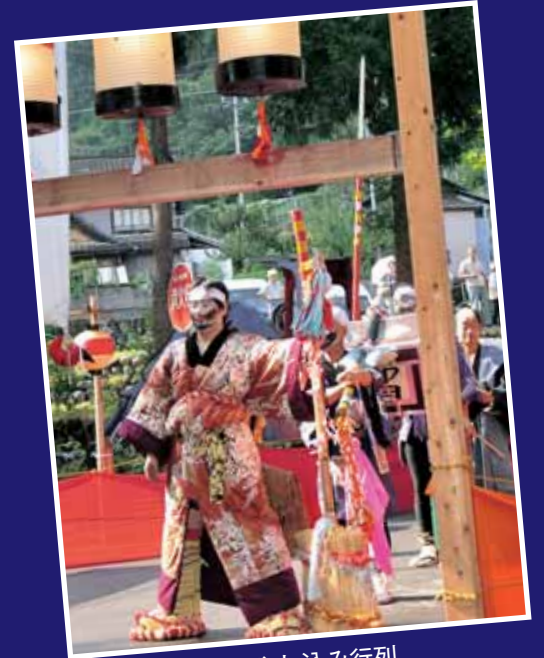
谷はやし込み行列