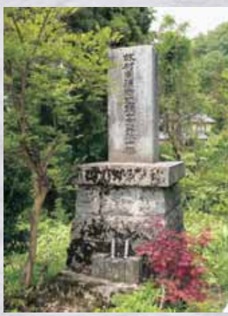
浄土寺と寺尾の間を走る国道157号の北沿いに建てられている